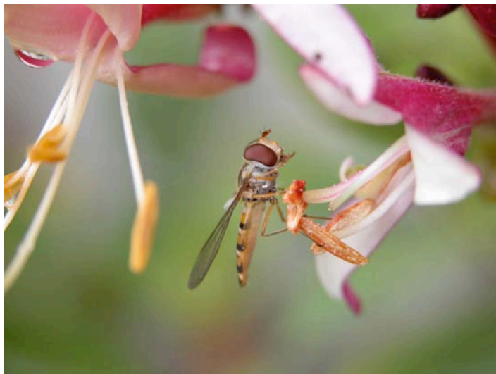
Episyrphus balteatus , en 8–12 mm lång blomfluga som är vanlig nästan överallt i hela Norden.

Tre arter som observerades eller fångades 2005 men som inte hittades 2006 ( Didea alneti , Melangyna