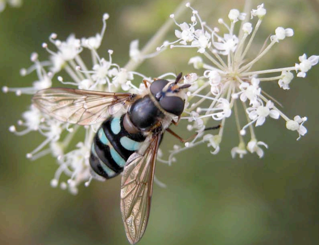
Didea alneti , som blir 12–16 mm lång, kan lätt kännas igen på de gröna eller turkosa teckningarna på bakkroppen. Den finns främst i öppen barrskog, men även i lövskog och finns över större delen av landet.

mossen finns ljung Calluna vulgaris och klockljung Erica tetralix .