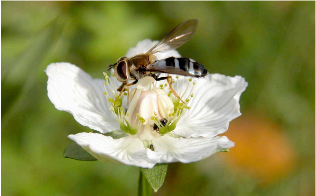
Ischyrosyrphus glaucius , en 11–13 mm lång blomfluga som förekommer framför allt i barr- och blandskogsområden från Skåne till polcirkeln. Här sitter den på en slätterblomma Parnassia palustris .

umbellatarum , Eristalis cryptarum ) har tagits med i listan men försetts med asterisk. Flugorna finns tills vidare i min privata samling.