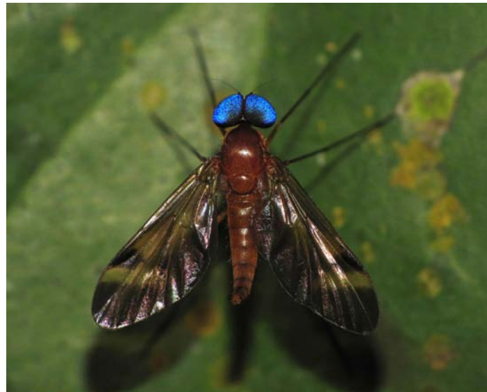
Blå ögon. En snäppflyga (familjen Rhagionidae) tillhörande släktet Chrysopilus . Campo Ma'an. Detta släkte har sju svenska representanter.