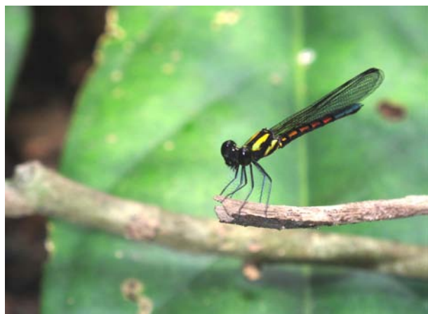
Trollsländan Chlorocypha cancellata, (familjen Chlorocyphidae) Campo Maan.