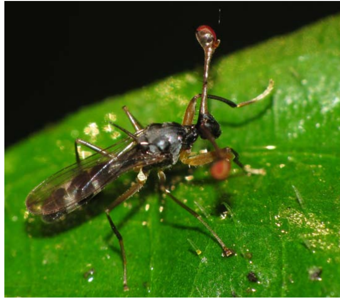
En art av de besynnerliga skafstögongflugorna (familjen Diopsidae). Det finns hundratals arter av skafstögongflugor i världen, varav nästan alla förekommer i tropikerna. Endast en art är känd från Europa och den upptäcktes i Ungern, så sent som 1996.

Utöver insekterna som visas på bild i denna artikel försökte vi oss också på att få se elefanter, men idogt spårande morgnar och kvällar gav inget resultat, trots färsk spillning. Näst sista morgonen började Fidele dock signalera att vi skulle vara tysta