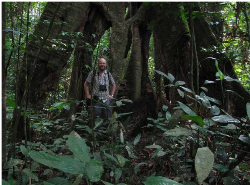
Artikelförfattaren framför ett jätteträd i Campo Ma'an.