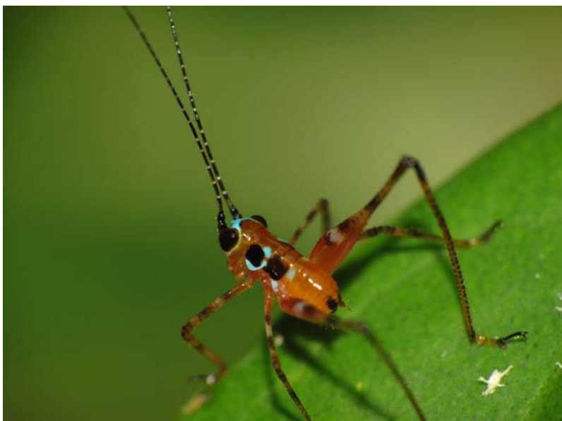
Överst t.v. Gräshoppan Pterotiltus impennis . Överst t.h. Pterotiltus inuncatus (familjen Acrididae ). Mount Kupé. Nederst t.v. Gräshoppenymf, Mount Kupé. Nederst t.h. Värbitarnymf , (familjen Tettigoniidae ), Campo Ma'an.

bevara skogarna. I Korup finns inga vägar, och man når dit via en hängbro över floden Mana. Väl över floden kommer man in i en helt fantastisk skog, som egentligen måste upplevas. Lianer är en viktig del av intrycket, och faktum är att Tarzan-filmen "Legenden om Lord Greystoke" spelades in här 1986. Förutom lianer och enorma träd är svampformiga termitstackar