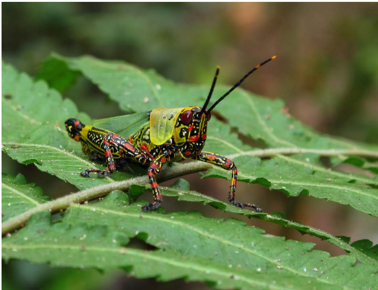
Harlekingrässhoppa Zonocerus variegatus (familjen Pyrgomorphidae), vid stranden av kratersjön Barombi Mbo.

ivrigt fotograferande trollsländor och andra insekter i kombination med ett visst mått av fågelskådande. Någon Bush-shrike sågs dock inte till. Ju högre upp man kommer desto mer ursprunglig blir skogen, och strax under toppen breder en plåt ut sig. Detta område tillhör det allra rikaste jag sett med avseende på mångfald av insekter.