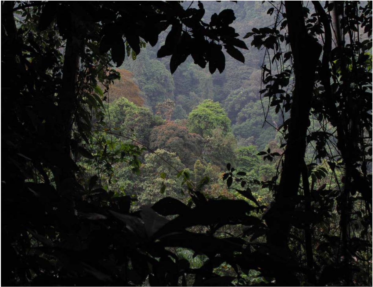
På väg uppför det beskogade Mount Kupé (2 062 m ö.h.). En lång rad arter är bara kända från området på och kring detta berg. De övriga områdena som beskrivs i artikeln är kustnära låglandsregnskogar.