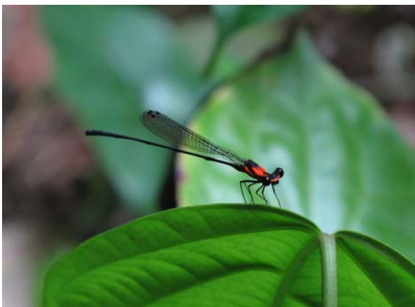
Flicksländan Prodasineura vittata (familjen Protoneuridae), Korup.