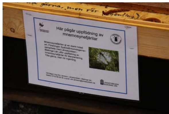
Fig. 4. Medlemmar i Föreningen Sydostentomologerna tillsammans med representanter för Länsstyrelserna i Blekinge och Uppsala län inspekterar uppfödning av mnemosynefjärilar i det gemensamma arbetet inom åtgärdsprogrammet för arten. Ett av många exempel där fjärilssamlare och myndigheter samarbetar.