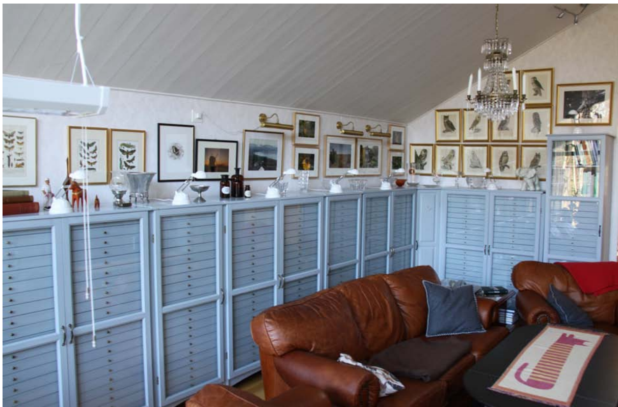
Fig. 2. Samlingen hemma i Dörby på Öland innehåller ca 30 000 preparerade fjärilar som belägg för fynd bland Nordens ca 3 000 arter av stor- och småfjärilar insamlade under 50 år.