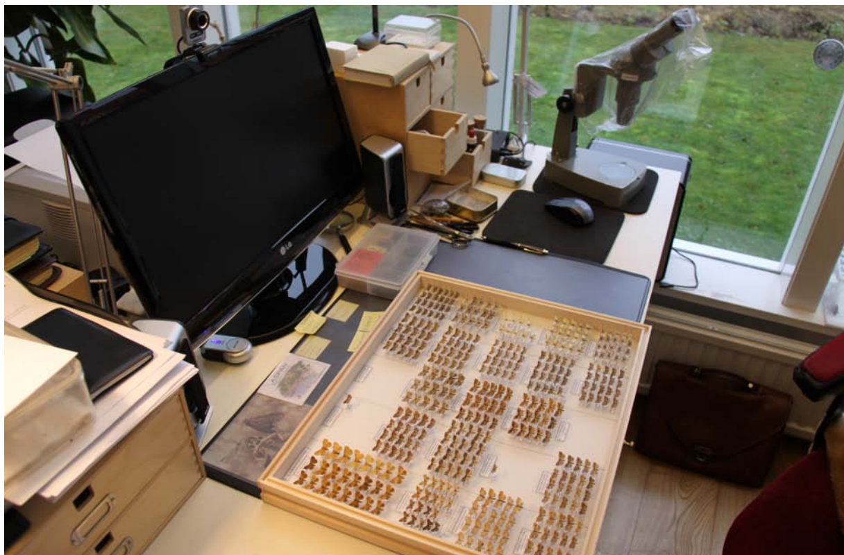
Fig. 3. En låda med vecklare på arbetsbordet.